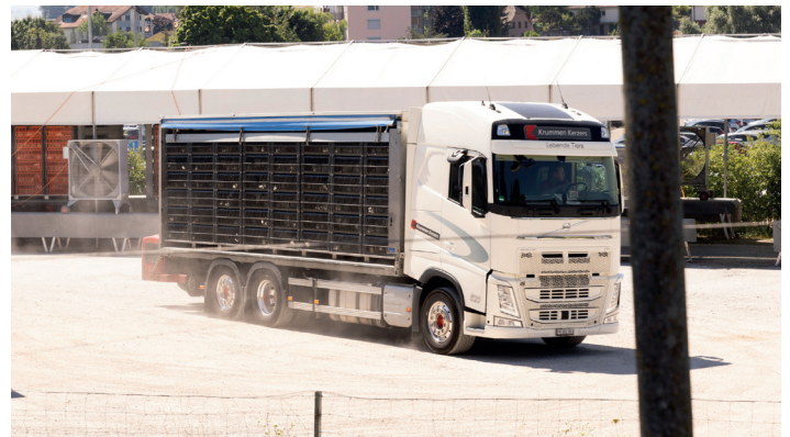
Ankunft von Hühnern, die per LKW zum Schlachthof transportiert werden