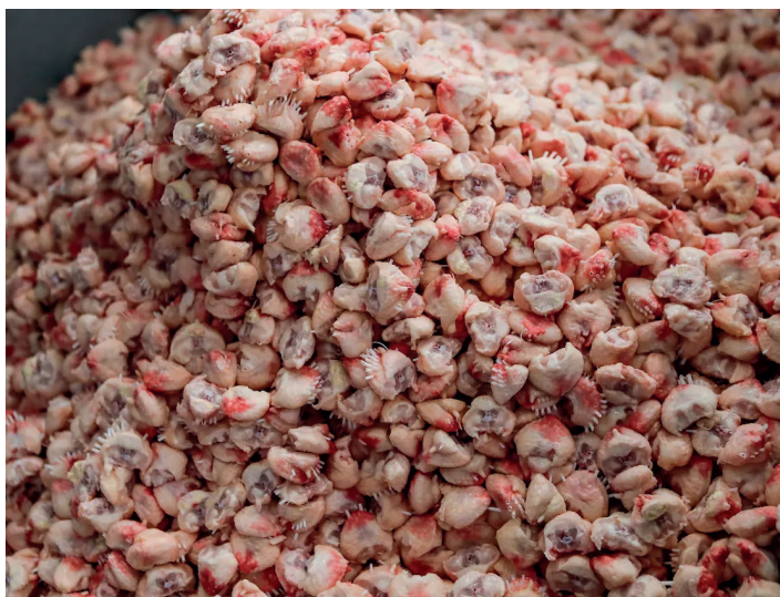
Hühnerköpfe nach der Enthauptung

Greenpeace Schweiz fordert, dass das AgriCo-Gelände wirklich innovativen und nachhaltigen Projekten im Agrar- und Ernährungssektor (z.B. Permakultur und Agroforstwirtschaft) vorbehalten bleibt. Er soll auf wirtschaftliche Aktivitäten ausgerichtet werden, die im Sinne eines widerstandsfähigeren Ernährungssystems die Region, die Umwelt und das Klima schonen.